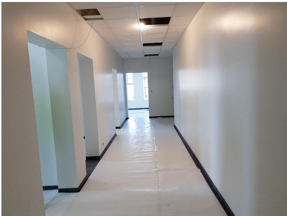
Dúklögn og uppsetning kerfisolfta vel á veg komin á 2.hæð í húsbýggingum A og B.