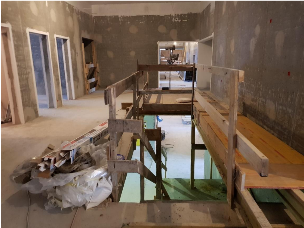
Unnið að frágangi innanhúss í húsbýggingu D, 2.hæð.