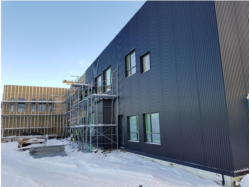
Unnið að utanhússklæðningu í húsbýggingu A, norðurhlíð.