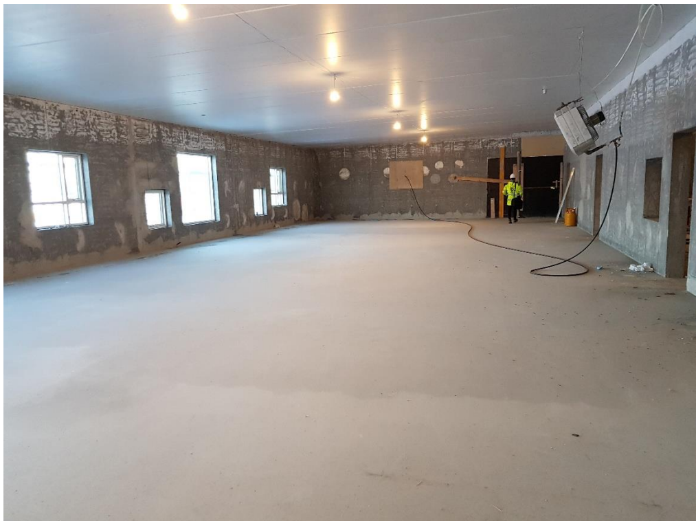
Búið að flota 1. og 2.hæð í húsi E. Ísetningu hurða og glugga er lokið.