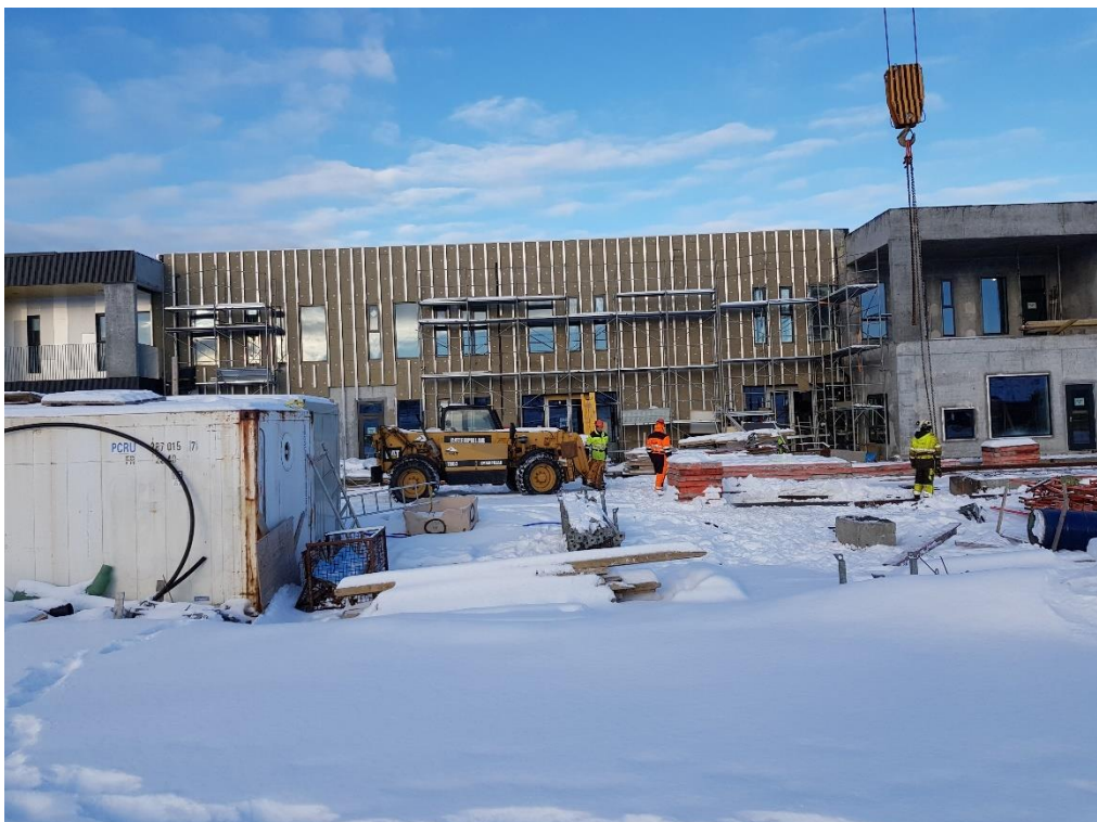
Búið að einangra útveggi og setja upp undirkerfi utanhússklæðningar í húsbyggingu D.