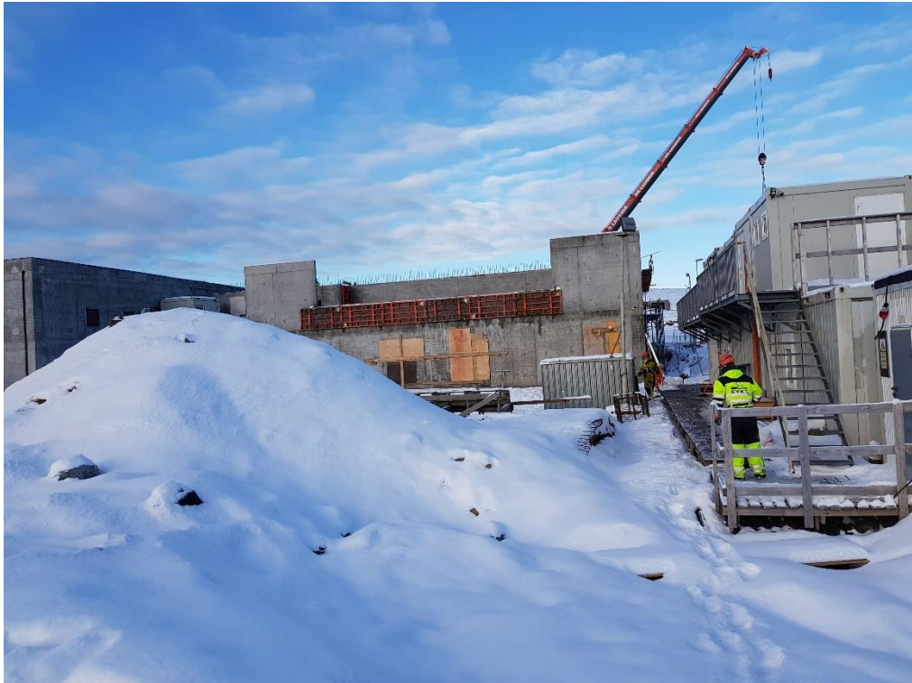
Unnið að hífingum holplatna yfir 2.hæð í húsbyggingu F.