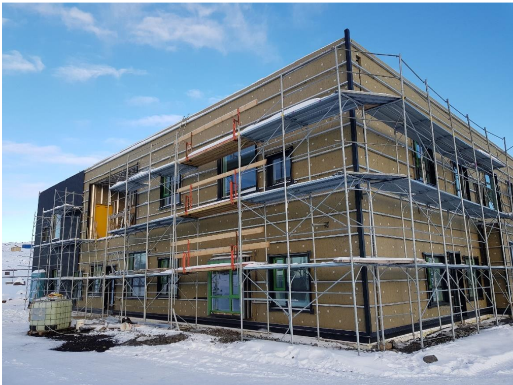
Unnið að utanhússklæðningu á gaffli húsbýggingar A.