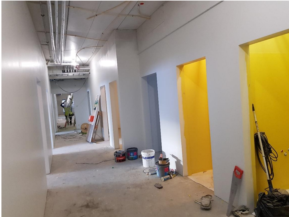
Frágangur innanhúss á 1.hæð í húsbýggingu A og B.