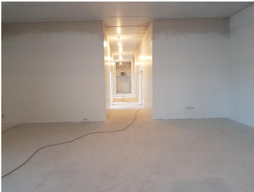
Búið að sparsla, grunna og mála eina umferð í skrifstofurými kennara, 2.hæð í húsi D.